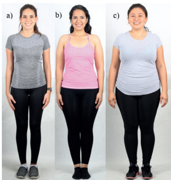
Figura 1. a) Ectomorfo b) Mesomorfo c) Endomorfo.

Olsson y Lindhe (1991), identificaron una variación existente entre los seres humanos con respecto a las características morfológicas del periodonto, clasificándolo según su grosor y los identificaban por dos morfotipos gingivales, denominados biotipos: delgado (46,7%) cuando los dientes anteriores presentan una corona clínica larga, estrecha y hueso alveolar delgado. A diferencia de un biotipo grueso (53, 3%) presenta en los dientes anteriores coronas clínicas cortas, amplias y hueso alveolar grueso. 14 Sin embargo, Müller y Eger (1997) reportaron haber encontrado biotipo delgado en pacientes con dientes que tenían coronas cortas y amplias, también en dientes con coronas estrechas y largas, Figura 1: a) Ectomorfo b) Mesomorfo c) endomorfo, por lo que podría haber tres biotipos periodontales. 12 En este estudio también se constató que el sexo influye mucho en las características fenotípicas de la encía. Llegando a la conclusión que la gingiva marginal es más delgada en individuos de sexo femenino que masculino (Müller 2000). 4