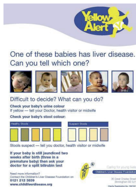
Figura 3. Cartilla yellow alert.

Según un estudio piloto realizado en Taiwan para detectar el color de las heces en los neonatos según la cartilla de colores (figura 3) en la consulta médica de control, se logró el diagnóstico precoz de pacientes con colestasis, la sensibilidad, especificidad y el valor predictivo positivo de la aplicabilidad del método de verificación del color de las heces de los neonatos, fueron del 89.7%, 99.9% y 28.6%, respectivamente. 12 Todos los lactantes detectados, fueron operados antes de los 90 días de vida, y la tasa de supervivencia a los 5 años aumentó de 37 a 64%, 9 cambiando el pronóstico de vida de los pacientes. 13 De esta manera se han desarrollado estrategias para la detección temprana de esta enfermedad logrando la conformación de un equipo integrado por padres y pediatras.