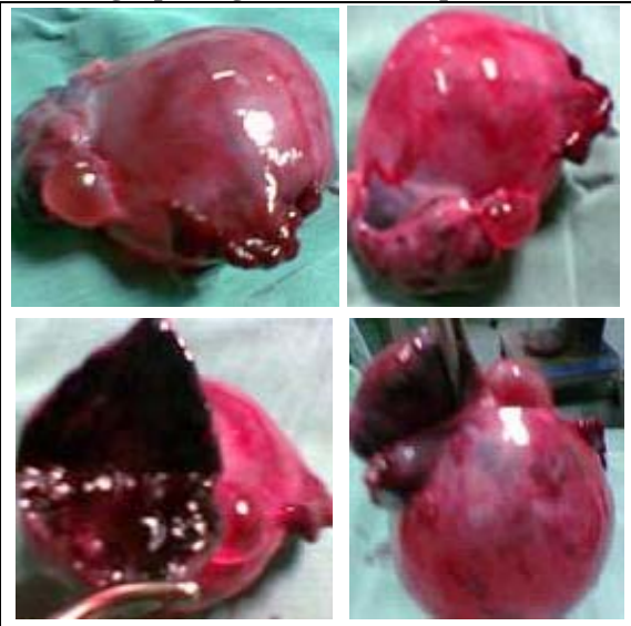
Figura 2 Hallazgo quirúrgico: torsión de quiste ovárico