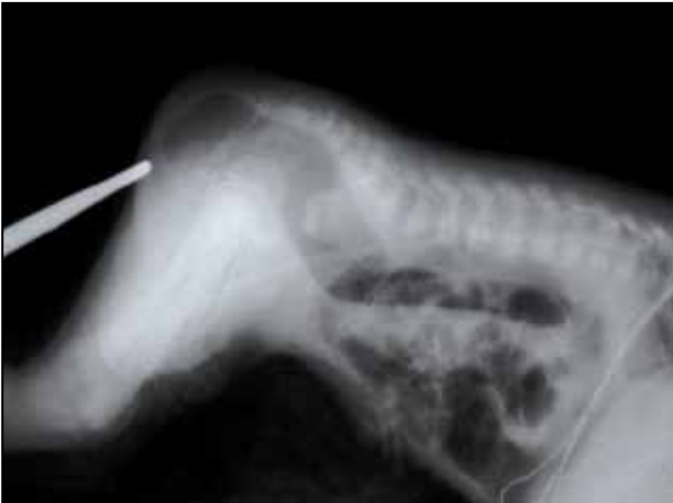
Figura 1. Invertograma. Se observa que columna de aire intestinal se encuentra a <1 cm de distancia de la marca radiopaca colocada en fosita anal.

Paciente es trasladado al hospital Francisco de Ycaza Bustamante, en el área de emergencia presentó cianosis peribucal con acrocianosis, recibiendo inmediatamente oxígeno por casco cefálico e ingresado al área de UCIN para valoración y tratamiento.