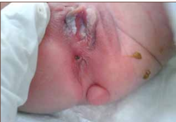
Figura 2. Patología anorrectal en paciente de sexo femenino, se observa ausencia de orificio anal y presencia de fístula a nivel perineal además de tumoración pediculada a nivel de línea interglútea.

Al examen físico paciente de sexo femenino que luce en condiciones hemodinámicamente estables, se inspecciona región perineal verificando inexistencia de ano y fístula perineal además de tumoración de aproximadamente 2 cm de diámetro móvil, pediculada y blanda en línea interglútea, con genitales femeninos normales (figura 2).