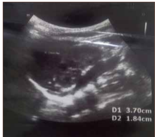
Figura 4. Imagen de silueta renal que mide 3,7 x 1,84 cm, de estructura homogénea, buena relación córtico-medular, observada en ultrasonido abdominal.

Se realizó estudio complementario mediante ecografía abdominal cuyo rastreo renal fue normal (figura 4).