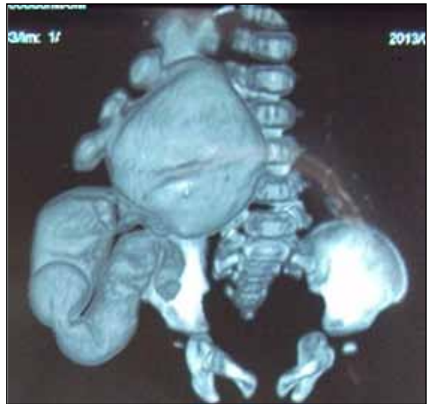
Figura 5. En la imagen de la uroresonancia magnética con reconstrucción en 3D, se aprecia los uréteres dilatados y tortuosos con disminución en el calibre de su porción más distal, hallazgos sugestivos de mega uréteres. Vejiga distendida con alteración en sus contornos y dilatación de la uretra posterior.