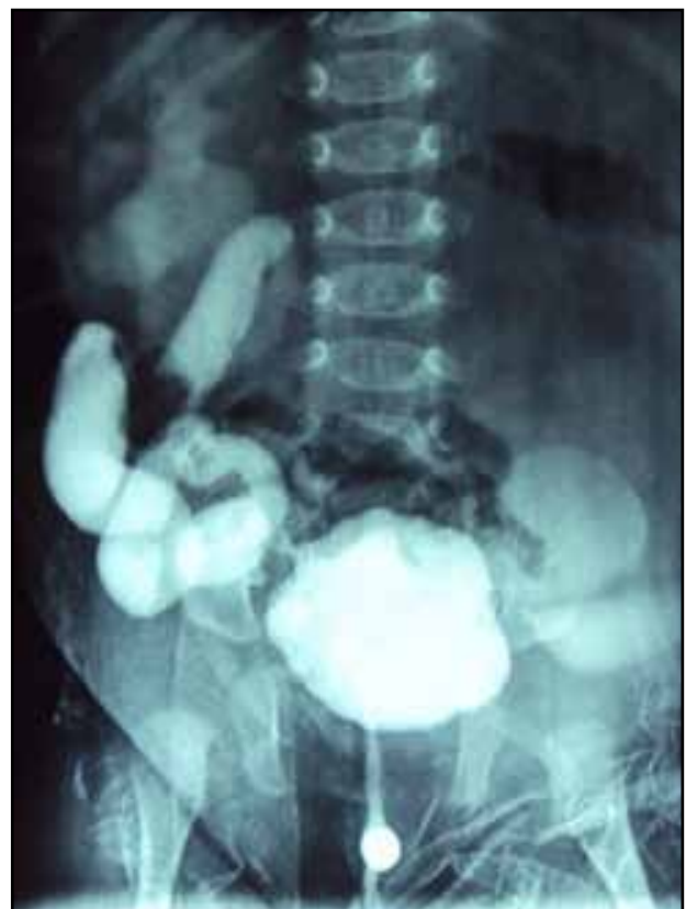
Figura 2. Se aprecia los uréteres dilatados y tortuosos con disminución en el calibre de su porción más distal. Vejiga distendida con alteración de sus contornos y dilatación de la uretra posterior.