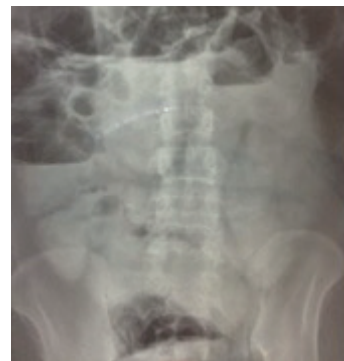
Figura 1. RX de abdomen que demuestra intestino delgado dilatado con presencia de niveles hidroaéreos.

En la placa de RX de abdomen, se visualiza patrón con intestino delgado muy dilatado muy probablemente a nivel de yeyuno con niveles hidroaéreos no llamativos puesto que se evacuó el contenido intestinal con sonda nasogástrica (Figura 1).