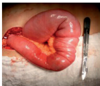
Figura 4. Masa yeyunal de aproximadamente 8 cm, con intususcepción, aproximadamente a 2 metros del ángulo de Treitz.

Posterior a estabilización de paciente, analgesia adecuada, valoraciones prequirúrgicas y complementación de exámenes de laboratorio e imagen; con un abdomen tenso, doloroso y distendido, se procede a realización de laparotomía exploratoria, encontrándose asas intestinales dilatadas, masa yeyunal de aproximadamente 8 cm de longitud con intususcepción a 2 metros del ángulo de Treitz (Figura 4).