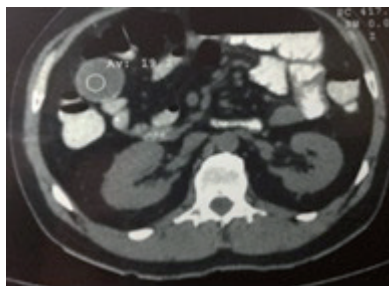
Figura 3. TAC contrastada de abdomen que demuestra el masa isodensa a nivel de intestino delgado.

Posterior a estabilización de paciente, analgesia adecuada, valoraciones prequirúrgicas y complementación de exámenes de laboratorio e imagen; con un abdomen tenso, doloroso y distendido, se procede a realización de laparotomía exploratoria, encontrándose asas intestinales dilatadas, masa yeyunal de aproximadamente 8 cm de longitud con intususcepción a 2 metros del ángulo de Treitz (Figura 4).