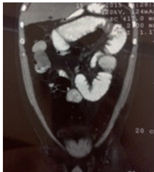
Figura 2. TAC contrastada de abdomen que demuestra el paso del contraste hasta el colon sigmoides, masa isodensa a nivel de intestino delgado.

La tomografía axial computarizada con contraste por vía oral, el mismo que llega hasta el colon sigmoides sin llegar a la ampolla rectal, y revela masa isodensa a nivel de intestino delgado (Figura 2,3).