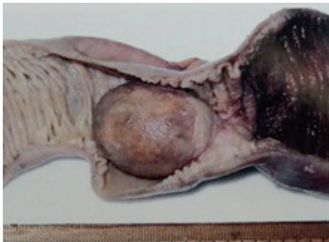
Figura 7. Corte microscópico que demuestra proliferación mesenquimosa y fibroblástica con infiltrado de predominio eosinófilo, compatible con pólipo fibroide inflamatorio.