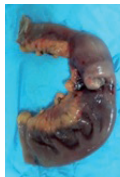
Figura 5. Masa yeyunal de aproximadamente 8 cm, con intususcepción, aproximadamente a 2 metros del ángulo de Treitz, muestra enviada al servicio de patología.

Con los hallazgos descritos se realiza resección de masa tumoral a 10 cm proximal y distal de sus márgenes, con muestra enviada a patología (Figura 5), se realiza anastomosis término-terminal, se limpia cavidad y se exteriorizan 2 drenajes desde corredera parietocólica izquierda y espacio rectovesical respectivamente; se cierra planos anatómicos. Cabe recalcar que no se observaron ni palparon ganglios linfáticos durante la intervención quirúrgica. Posteriormente el paciente pasa a sala de recuperación, en donde presenta taquipnea, control de gasometría arterial revela acidosis metabólica; se corrige estado metabólico y es enviado a hospitalización.