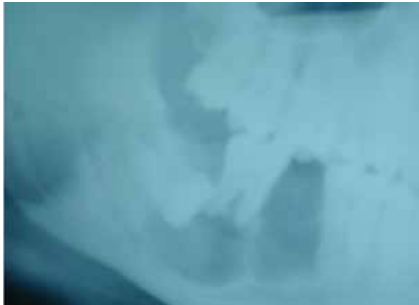
Figura 3. Radiografía con zonas radiolúcidas en zona posterior.

El día 21 de diciembre de 2014 acude al Instituto de Cirugía Oral y Maxilofacial un paciente masculino de 23 años de edad con tercer molar inferior derecho retenido y radiográficamente presenta imagen radiolúcida de grandes proporciones.