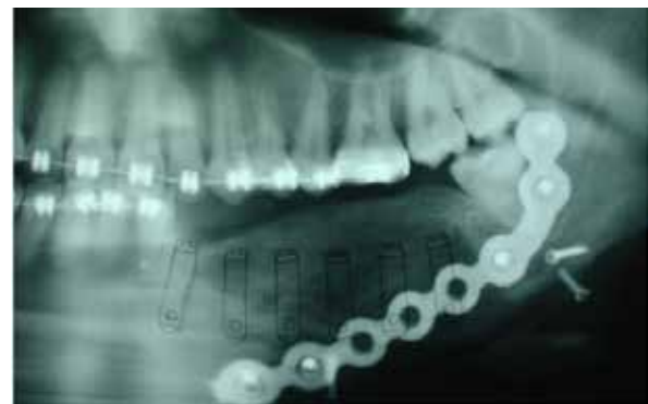
Figura 1. estudio radiográfico para evaluar fijación ósea.

Se comprueba dicha patología con tomografía computarizada. Mediante biopsia incisional el estudio histopatológico, reporta el siguiente resultado: mixoma odontogénico. Se programa para resección en bloque de mixoma y reconstrucción inmediata con placa de reconstrucción mandibular, más injerto de cresta iliaca posterior con plasma enriquecido en factores de crecimiento. Usando los criterios de abordaje y protocolo para extirpaciones tumorales mandibulares.