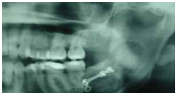
Figura 5. Radiografía con presencia de radiolúcidas con bordes definidos compatibles con quiste mandibular.

El 23 de mayo de 2014, acude al Instituto de Cirugía Oral y Maxilofacial un paciente de 60 años que presenta imagen radiolúcida a nivel de tercer molar inferior izquierdo. El resultado histopatológico demuestra que se trata de quiste dentígero. Se programa quistectomía más relleno del defecto con injerto de hueso de banco mezclado con plasma enriquecido en plaquetas. Se fijará nuevamente la cortical con miniplaca y tornillos de titanio. Figura 5