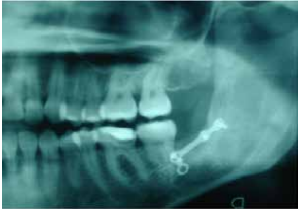
Figura 6. radiografía donde se aprecia osificación ósea y radiopacidad compatible con mini placa de osificación mandibular.

La imagen corresponde a una semana posterior a cirugía. A los 30 días se realiza Rx. de control donde es claramente visible la consolidación total del injerto. A los 6 meses de cirugía no hay evidencia de recidiva quística y cicatrización total del injerto, figura 6.