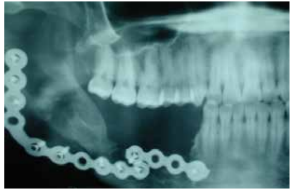
Figura 4. radiografía de control con radiopacidades compatibles con placas de fijación ósea.

El paciente presenta necrosis pulpar de premolar y se remite a odontóloga que no realiza tratamiento de endodoncia, dando como resultado un absceso apical y por consiguiente propagación del cuadro infeccioso a través del hueso neoformado. Se realiza exodoncia de premolares, secuestrectomía, curetaje y se decide colocar una placa de reconstrucción más superior para afianzar el tejido neoformado. 3 meses después se toma rx de control y se aprecia que todavía no se tiene una osificación completa.