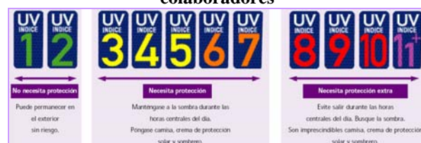
Figura 3 Recomendación conjunta de la OMS y colaboradores